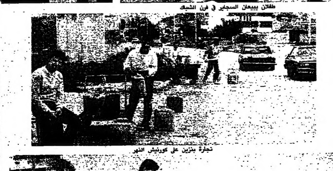
تجارة يميزن على كورنيش النهر